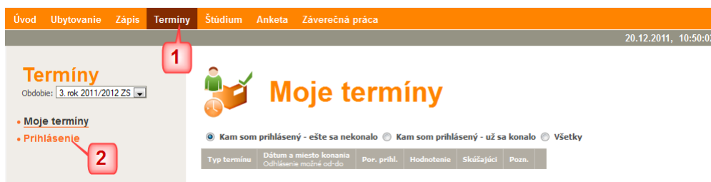
Obr. 2: Menu pre prihlasovanie sa na termíny

V systéme MAIS môže byť študent naraz prihlásený len na jeden termín skúšky z konkrétneho predmetu.